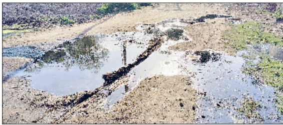
बवानीखेड़ा। बवानीखेड़ा की हुड्डा कॉलोनी में सीवरेज के गंदे पानी की समस्या।