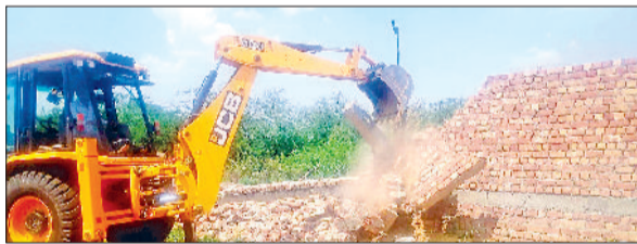
भिवानी। अवैध निर्माण को गिराती जेसीबी।