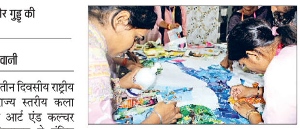
भिवानी। कोलाज बनाती छात्राएं।