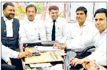
भिवानी। बार एसोसिएशन के चुनाव को लेकर चर्चा करते अधिवक्ता।