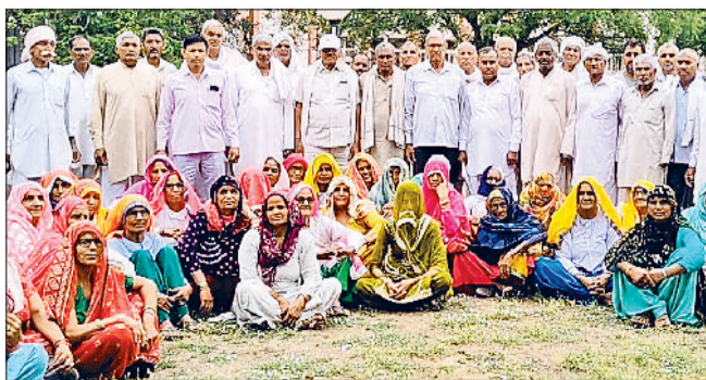
भिवानी। उपायुक्त से मिलने जाते गांव प्रहलादगढ़ के ग्रामीण।