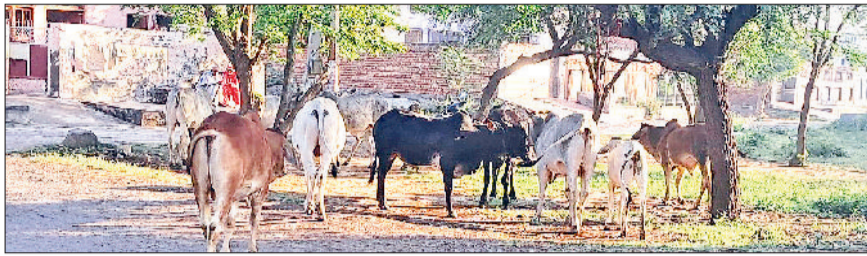
बवानीखेड़ा। कस्बे में विचरण करते आवारा पशु।

आवारा पशुओं ने पिछले दिनों वृद्ध महिला को बनाया था शिकार