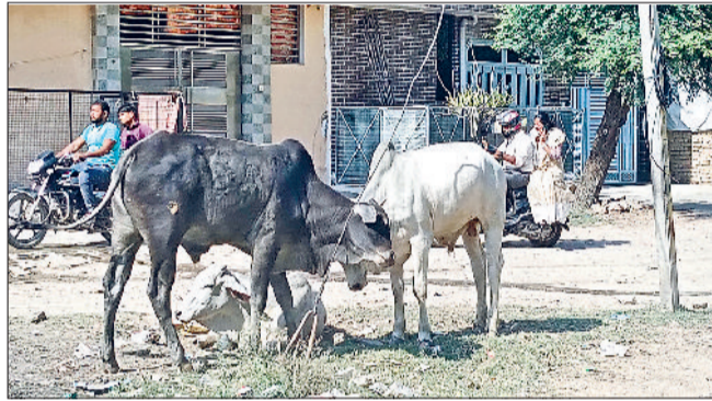
भिवानी। सड़क पर लड़ते गोवंश व बाइकों पर वहां से गुजरते लोग और सर्कुलर रोड पर खड़ा गोवंश व गुजरता राहगीर व वाहन।

उल्लेखनीय है कि शहर की सड़कों, बाजारों व चौक चौराहों पर बेसहारा गोवंश का जमावड़ा लगा रहता है जिसके कारण कई बार हादसे भी हो चुके हैं। सबसे बड़ी समस्या तो रात को होती है, जब गोवंश सड़क के बीच खड़े हो जाते हैं या बैठे होते हैं। वाहनों की रोशनी में रात के समय ये नजर नहीं आते, जो जिनसे दुर्घटनाएं हो जाती हैं। शहर में एक नंदीशाला सहित दर्जनभर गोशालाएं संचालित हैं। इसके बावजूद गोवंश सड़कों पर घूमता नजर आता है, जो राहगीरों व वाहन चालकों के लिए खतरा बने हुए है। अक्सर सड़कों पर गोवंश लड़ते नजर आते हैं, जो वहां से निकलने वालों को चोट पहुंचाते हैं। वैसे तो नगर